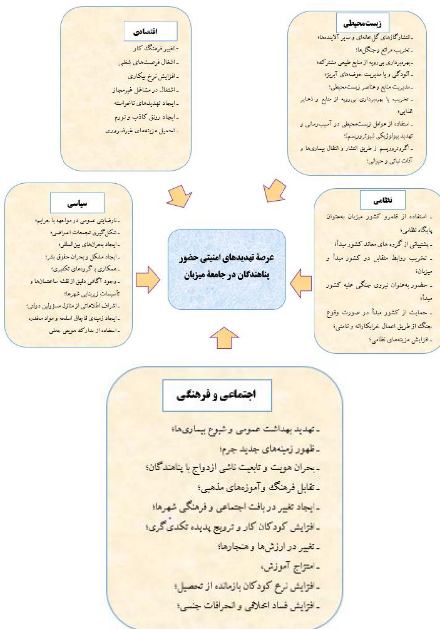
نمودار ۲. ابعاد امنیتی پناهندگان در جامعه میزبان