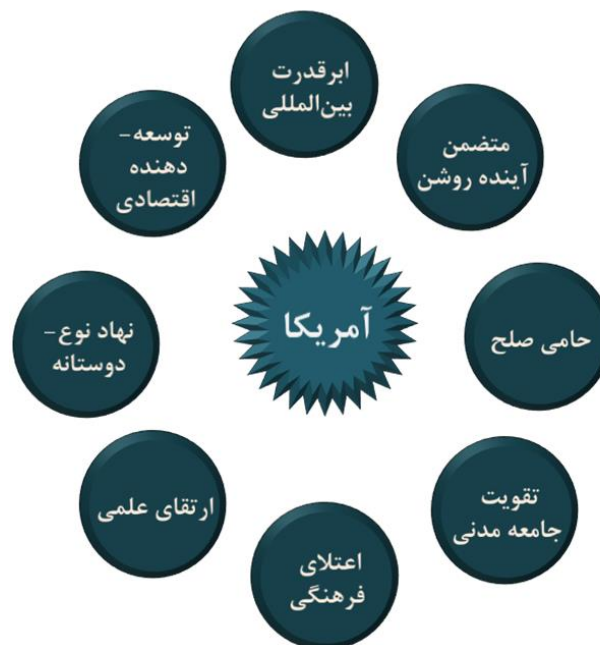
شکل ۲. مفاهیم بازنمایی شده در وبسایت‌های سازمان‌های بشردوستانه آمریکایی

همچنین تحلیل محتوای دو وبسایت متعلق به سازمان‌های بشردوستانه آمریکایی در عراق و مطالعه مفاهیم بازنمایی شده در این وبسایت‌ها، گویای این مطلب است که اساسی‌ترین مفاهیمی که سازمان‌های آمریکایی بر آن‌ها متمرکز شده و از