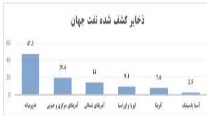
نمودار ۱ نمودار شماره ۱: ذخایر کشف شده نفت جهان

خلیج فارس قرار دارند. از این رو شایسته است که کشورهای حاشیه خلیج فارس که دارای میدان‌های گازی مشترک می‌باشند (ایران، قطر و عربستان) با نظم بخشیدن به برداشت خود از این میادین زمینه‌های رقابت را از بین ببرند و دامنه همکاری‌ها را گسترش دهند (کامران و همکاران، ۱۳۹۰:۸۰). عربستان سعودی به دنبال آسیب رساندن به