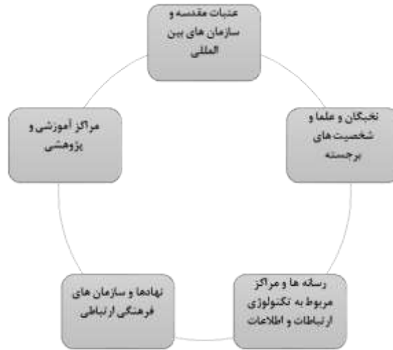
شکل شماره (۴). بازیگران دیپلماسی فرهنگی زیارت اربعین