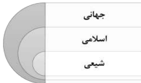
شکل شماره (۳). حوزه‌های فرهنگی مخاطبان دیپلماسی فرهنگی زیارت اربعین