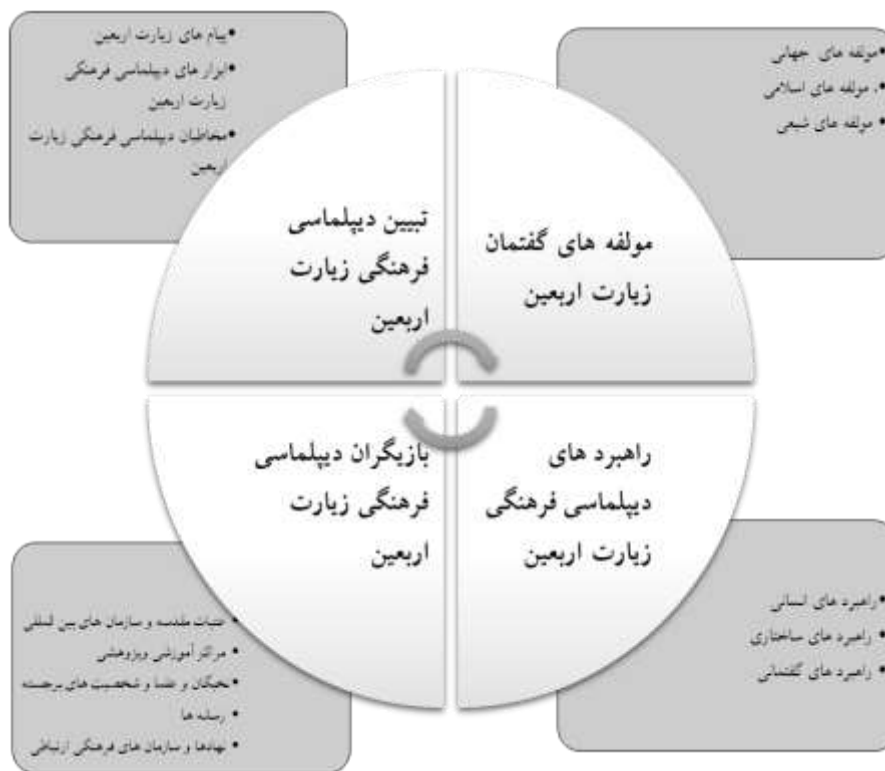
شکل شماره (۱). دپلماسی فرهنگی زیارت اربعین

دپلماسی فرهنگی آیین پیاده روی ... / هادی غیائی و همکاران ..... ۲۳۳ عبارتند از: «عتبات مقدسه و سازمان‌های بین‌المللی»، «مراکز آموزشی و پژوهشی»، «نخبگان و علما و شخصیت‌های برجسته»، «رسانه‌ها و مراکز مربوط به فناوری ارتباطات و اطلاعات» و «نهادهای و سازمان‌های فرهنگی ارتباطی». در نهایت مضامین پایه‌ی مربوط به مضمون سازمان دهنده «راهبردهای دپلماسی فرهنگی زیارت اربعین» عبارتند از: «راهبردهای انسانی»، «راهبردهای ساختاری» و «راهبردهای گفتمانی (شکل شماره ۱).