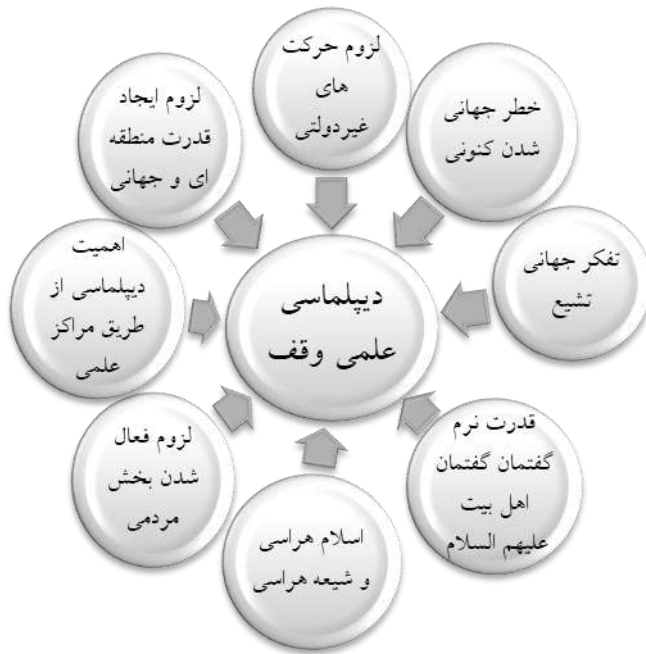
شکل شماره (۵). ضرورت دیپلماسی علمی وقف

خارجۀ آمریکا که از اهداف اصلی این دفتر، مشارکت سازی با جوامع علمی ملی و بین‌المللی و ارائه مشاوره دقیق علمی و فناوری به وزارت امور خارجه این کشور است ( STAS Website) (برگرفته از مجله مطالعات قدرت نرم، ۱۳۹۳، ص ۱۲۸)».